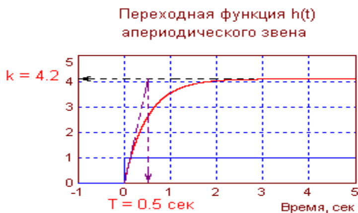
Рис. 2.3. Переходная функция аперiodического звена

Написание обозначений единиц физических величин. При написании числовых значений величин используют обозначения единиц буквами или специальными знаками, например, 5 А; 8,2 Н; 12 Вт; 120°; 15'; 28%. Между последней цифрой числа и обозначением единицы физической величины следует оставлять пробел, исключение составляют знаки, поднятые над строкой. Не допускается перенос обозначения единиц на следующую строку.