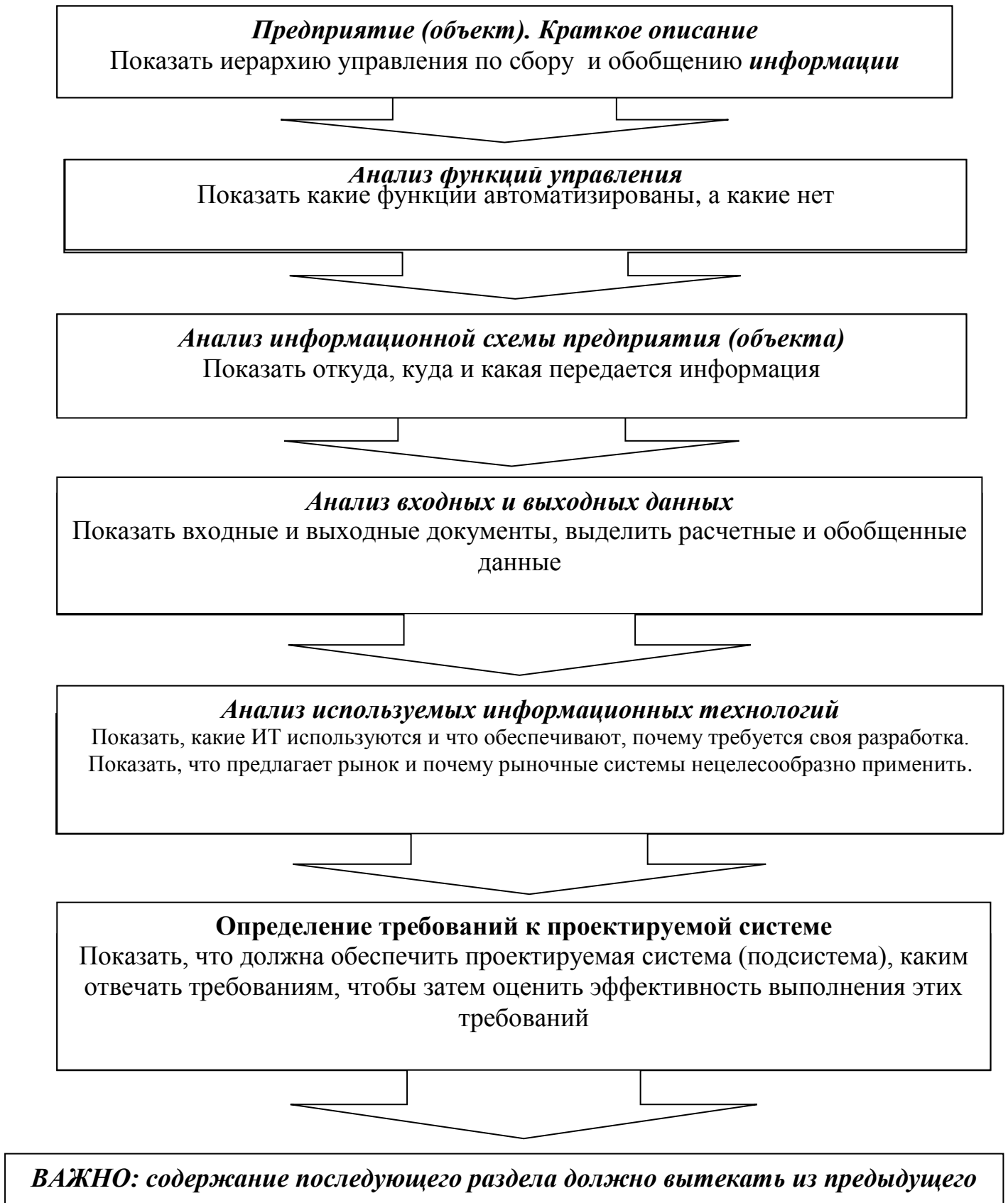
Схема изложения материала по аналитике (по первой главе)