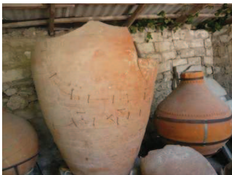
Рисунок 1 – Древнегреческая керамика