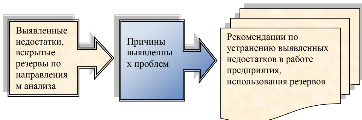
Рисунок 1. – Алгоритм составления выводов по аналитической части

Алгоритм выполнения данного раздела представлен на рис. 1. На основе обобщения студентом предлагаются направления и конкретные мероприятия по совершенствованию исследуемой проблемы.